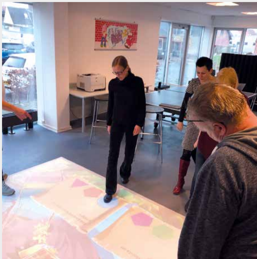
Med active floor sætter vi blandt andet fokus på bevægelse i undervisningen

VUC Storstrøm spænder over et område på omkring 3400 km 2 med ca. 270.000 indbyggere og er fordelt på seks lokale afdelinger med cirka 100 kilometer mellem Nakskov og Næstved.